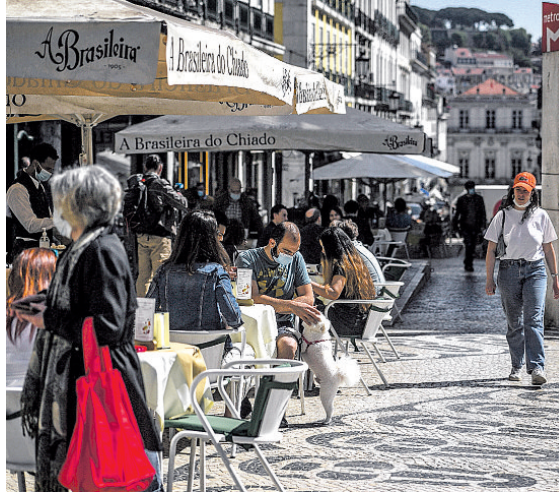
Pessoas voltaram a ocupar ontem mesas em cafés no bairro do Chiado, em Lisboa