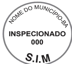
Modelo 4: 5cm de diâmetro