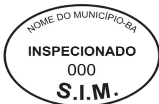
Modelo 1: 7x5cm