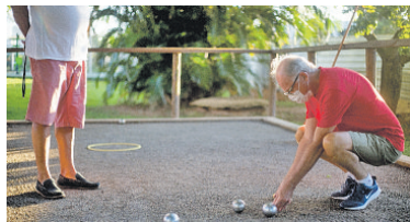
Pétanque traz algumas semelhanças com outro jogo: bola de gude