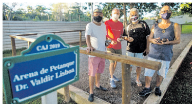
Esporte ganhou até 'arena' em condomínio de praticante baiano