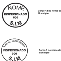
Modelo 3: 2cm de diâmetro