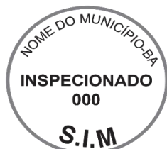
Modelo 4: 5cm de diâmetro