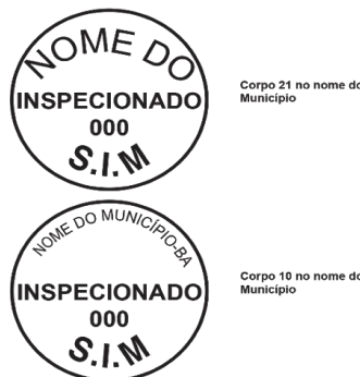
Modelo 3: 4cm de diâmetro