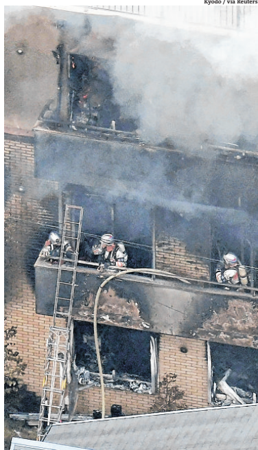
Kyoto / via Reuters

Dois vítimas ficaram presas no térreo e outras 31 nos dois andares ou nas escadas que levavam ao telhado, disse um porta-voz dos bombeiros à AFP. “Continuamos evacuando os indivíduos presos no prédio, alguns dos quais talvez não sejam capazes de se mover sozinhos”, acrescentou a fonte. O incêndio irrompeu às 10h30 (23h30 de Brasília), em um prédio da empresa Kyoto Animation, que produz séries animadas de grande sucesso na televisão japonesa. Três horas depois, estava quase controlado,