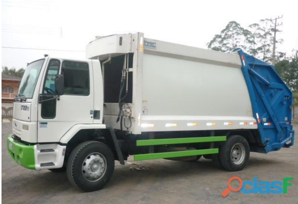
FOTO DE CAMINHÃO TOCO EQUIPADO COM COLETOR COMPACTADOR