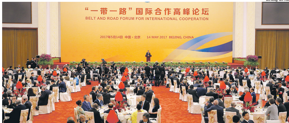
Capital chinesa recebe líderes de 29 países para discutir a abertura comercial. Anfitriões anunciaram verba para financiar infraestrutura

COMÉRCIO EXTERIOR Encontro em Pequim teve a presença dos presidentes da Rússia, Vladimir Putin, e da Turquia, Recep Tayyip Erdogan, entre outros