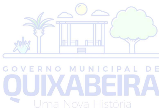
Reginaldo Sampaio Silva Prefeito Municipal

Endereço: Praça 21 de Abril, s/n, Centro, Quixabeira – Bahia CEP: 44.713-000. Telefone: 74 3676 -1026 CNPJ: 16.443.723/000103E-mail: quixabeira.gov@gmail.com