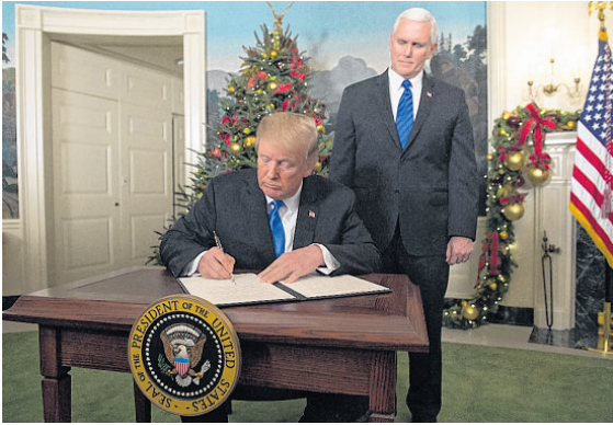
O presidente dos Estados Unidos assina uma proclamação após reconhecimento

O papa Francisco pediu que fosse respeitado o status quo de Jerusalém — considerado território especial e fora da soberania do estado. Ele alertou que medidas contrárias poderiam inflamar os conflitos pelo planeta. China e Rússia se mostraram preocupadas com a