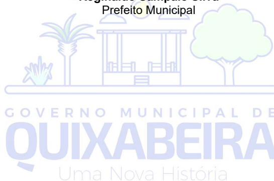
Reginaldo Sampaio Silva Prefeito Municipal

Endereço: Praça 21 de Abril, s/n, Centro, Quixabeira – Bahia CEP: 44.713-000. CNPJ:16.443.723/000103 E-mail: quixabeira.gov@gmail.com