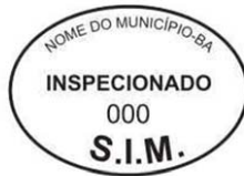
Modelo 1: 7x5cm