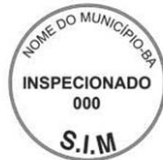
Modelo 4: 5cm de diâmetro