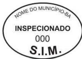
Modelo 1: 7x5cm