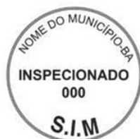
Modelo 4: 5cm de diâmetro