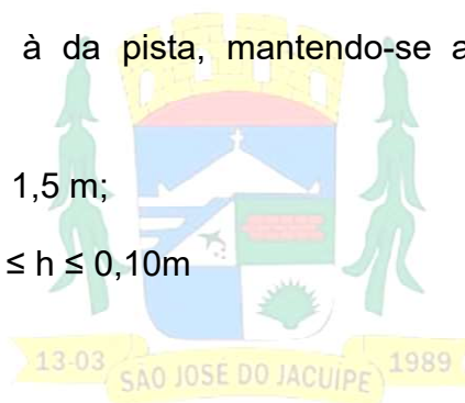
Figura 2 - Detalhes da lombada.