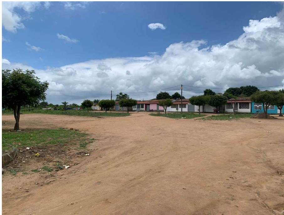
Figura 01 – Descrição da área destinada à construção da Praça da Portelinha no Distrito de Itatiaia, município de São José do Jacuípe-BA.