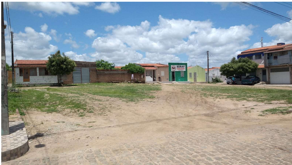
Figura 04 – Descrição da área destinada à construção da Praça da Divineia na sede do município de São José do Jacuípe-BA.