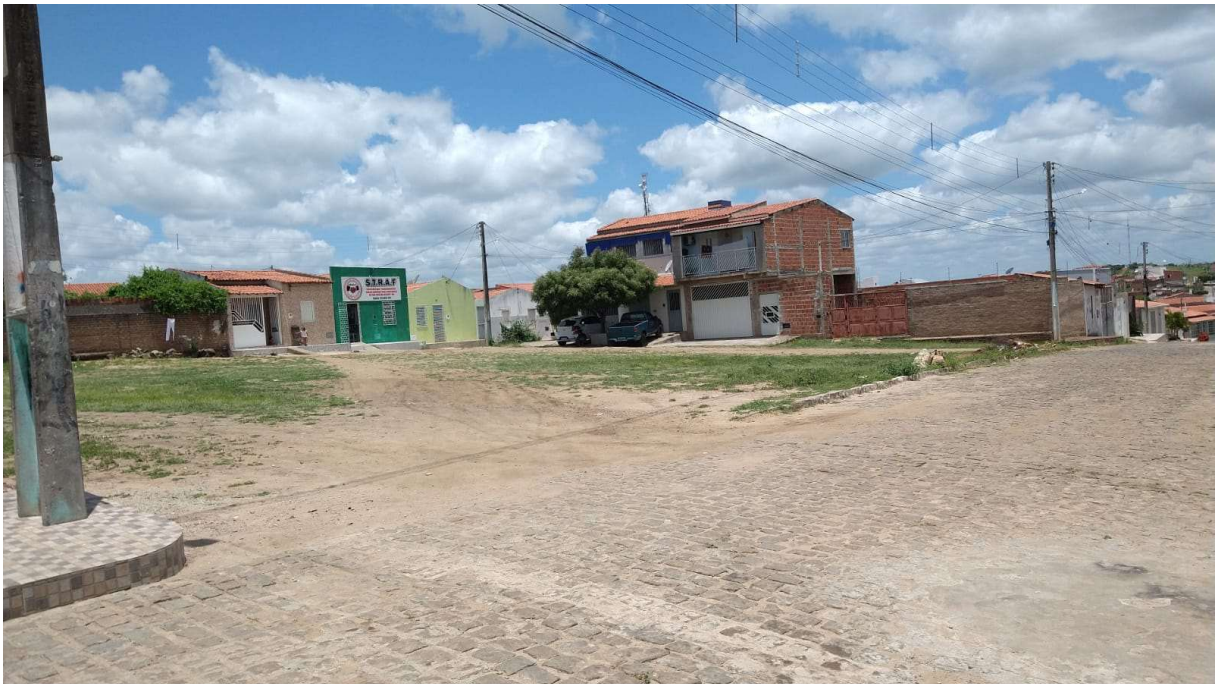
Figura 05 – Descrição da área destinada à construção da Praça da Divineia na sede do município de São José do Jacuípe-BA.