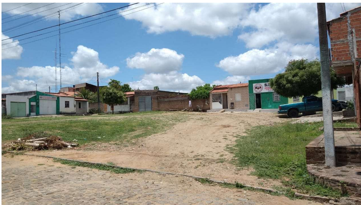
Figura 03 – Descrição da área destinada à construção da Praça da Divineia na sede do município de São José do Jacuípe-BA.