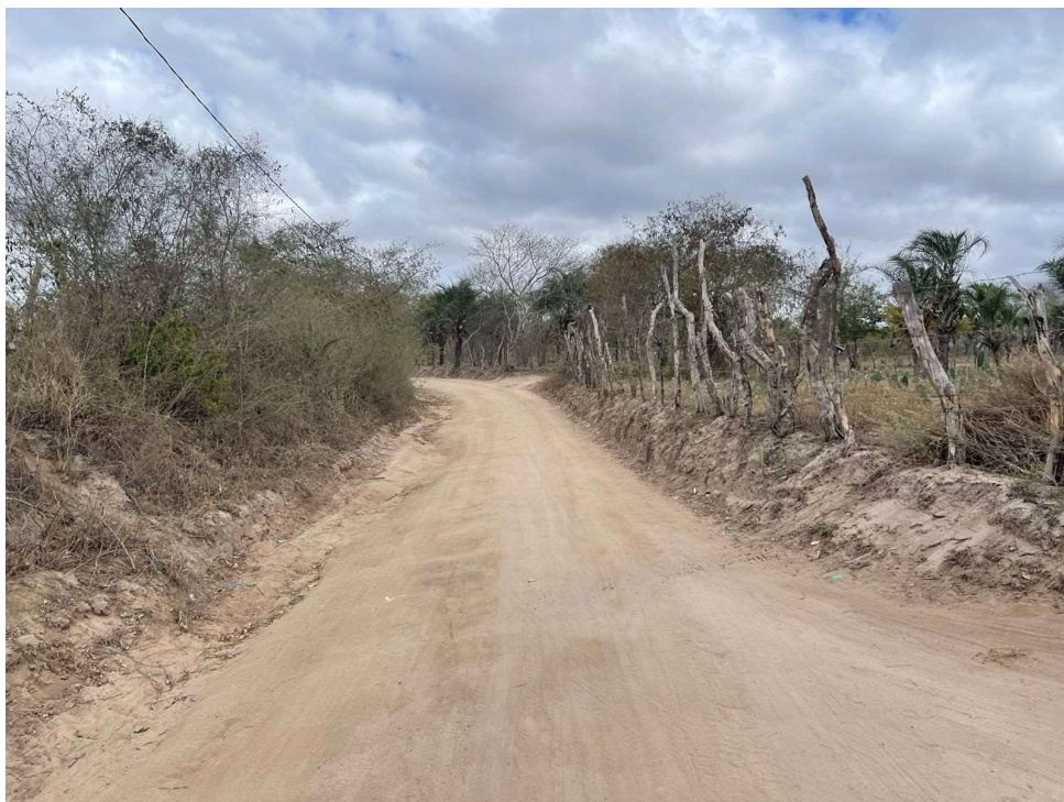
Figura 04 – Pavimentação existente das estradas vicinais citadas.