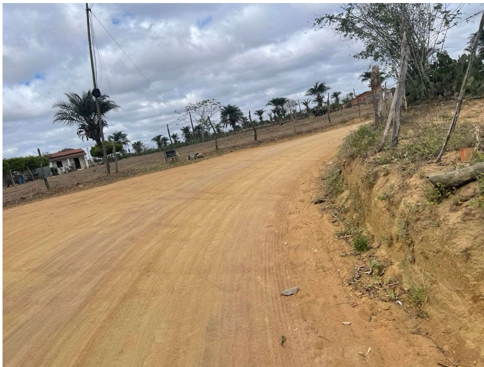
Figura 07 - Pavimentação existente das estradas vicinais citadas.