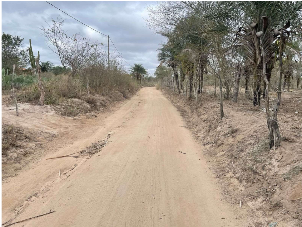
Figura 03 – Pavimentação existente das estradas vicinais citadas.