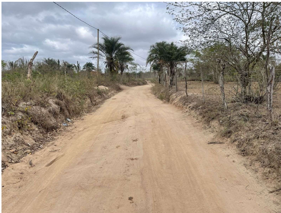
Figura 05 – Pavimentação existente das estradas vicinais citadas.