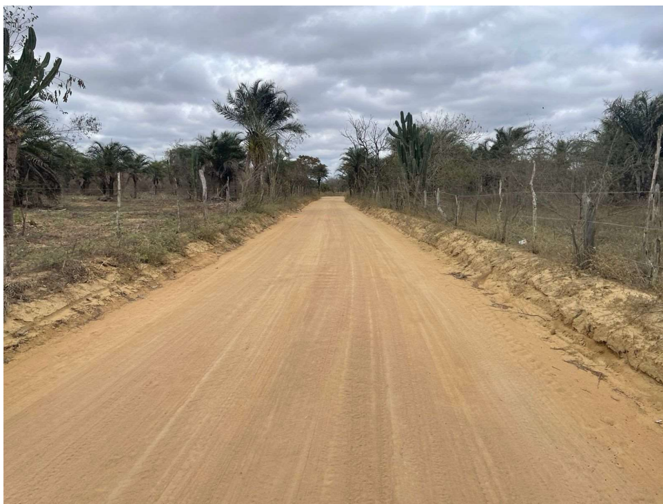
Figura 08 - Pavimentação existente das estradas vicinais citadas.