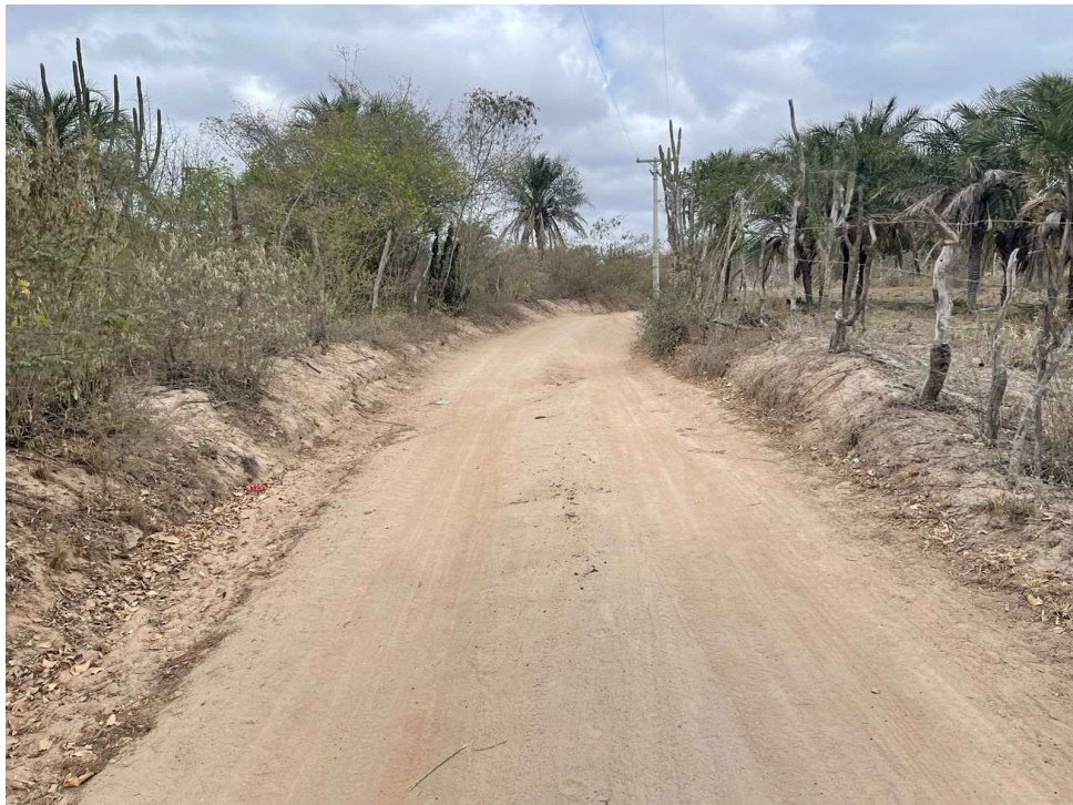
Figura 02 – Pavimentação existente das estradas vicinais citadas.