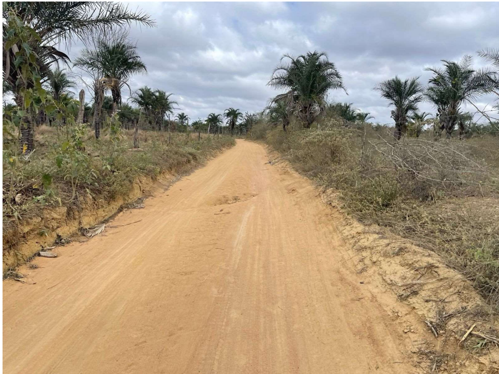
Figura 01 – Pavimentação existente das estradas vicinais citadas.