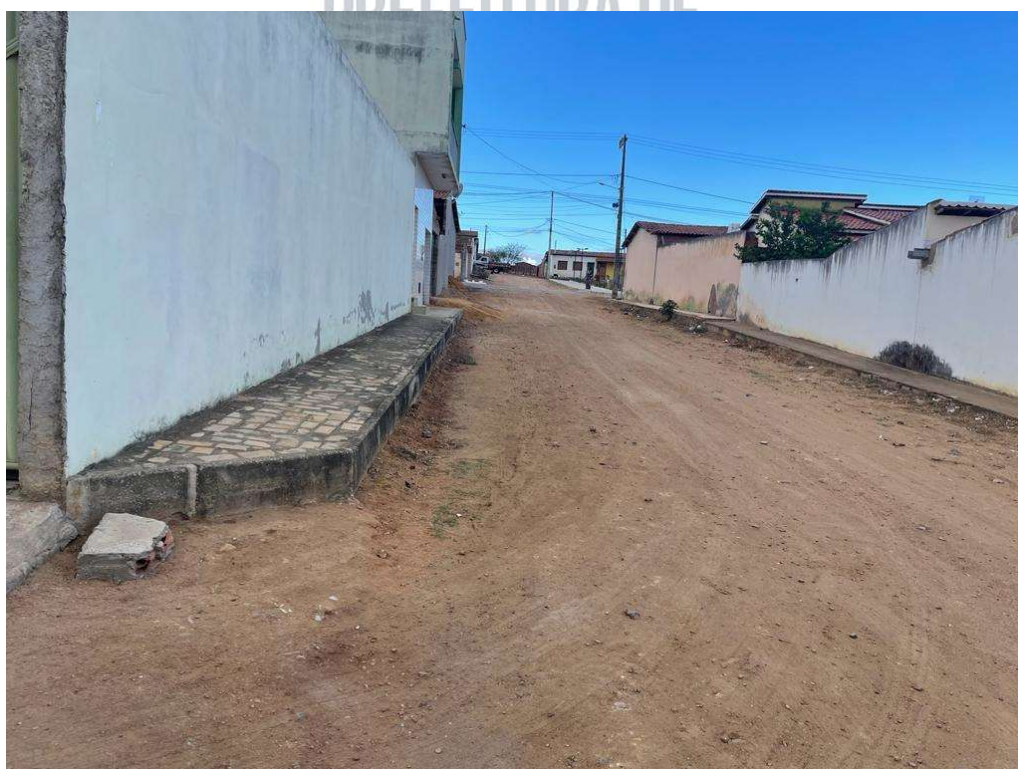
Figura 02 – Descrição da área destinada à pavimentação em paralelepípedo da rua Manuel Barreto localizada na sede município de São José do Jacuípe-BA.