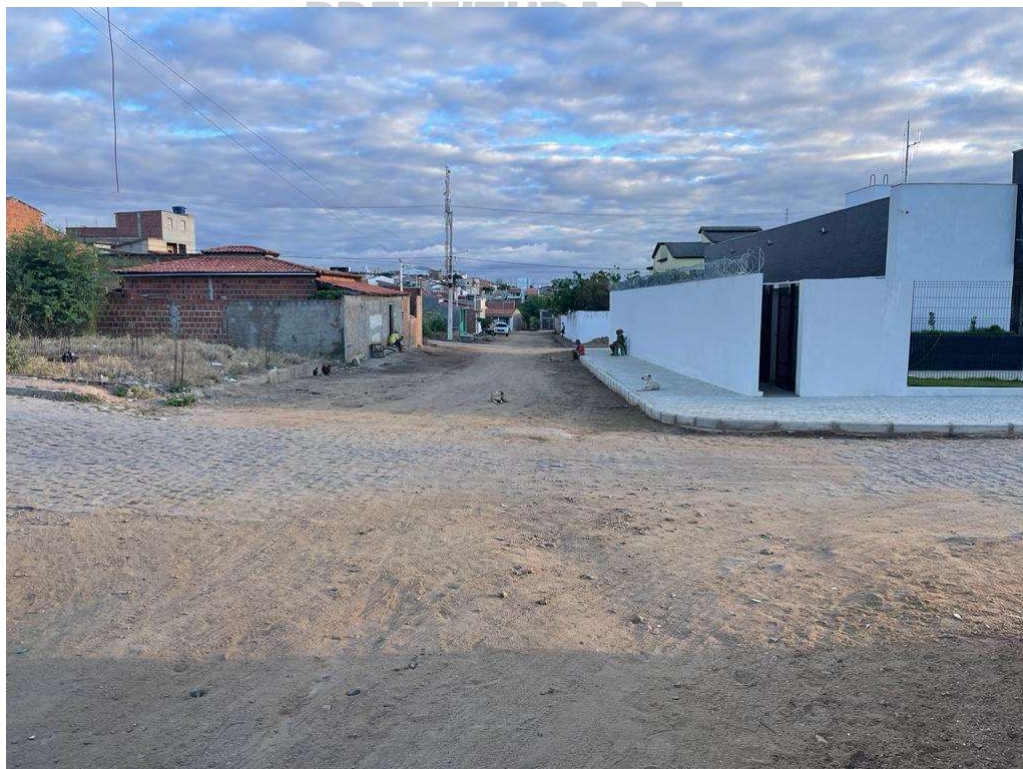
Figura 10– Descrição da área destinada à pavimentação em paralelepípedo Rua Gilberto Dias Miranda localizada na sede município de São José do Jacuípe-BA.