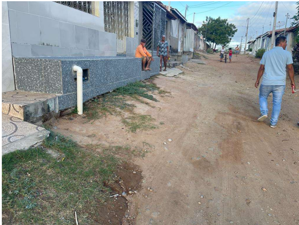
Figura 09 – Descrição da área destinada à pavimentação em paralelepípedo da rua Amando Fernandes localizada na sede município de São José do Jacuípe-BA.