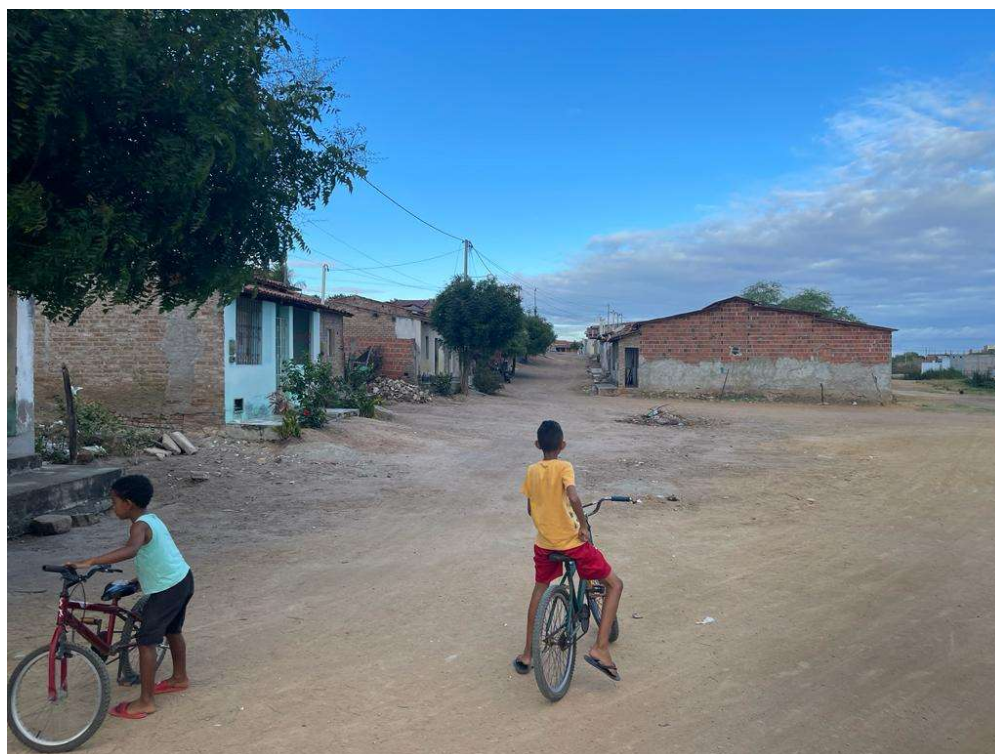
Figura 05 - Descrição da área destinada à pavimentação em paralelepípedo Rua Juez Ferreira localizada na sede município de São José do Jacuípe-BA.