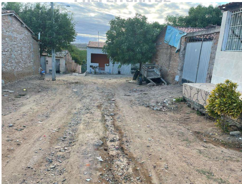
Figura 08 – Descrição da área destinada à pavimentação em paralelepípedo da rua Amando Fernandes localizada na sede município de São José do Jacuípe-BA.