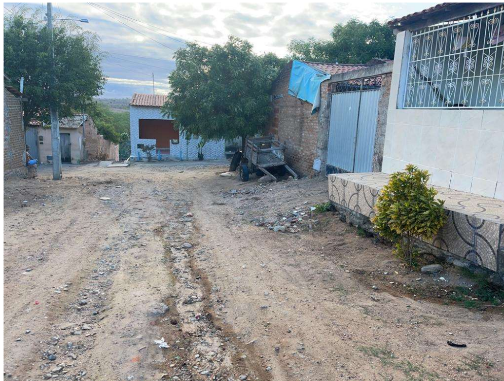
Figura 07 – Descrição da área destinada à pavimentação em paralelepípedo da rua Amando Fernandes localizada na sede município de São José do Jacuípe-BA.