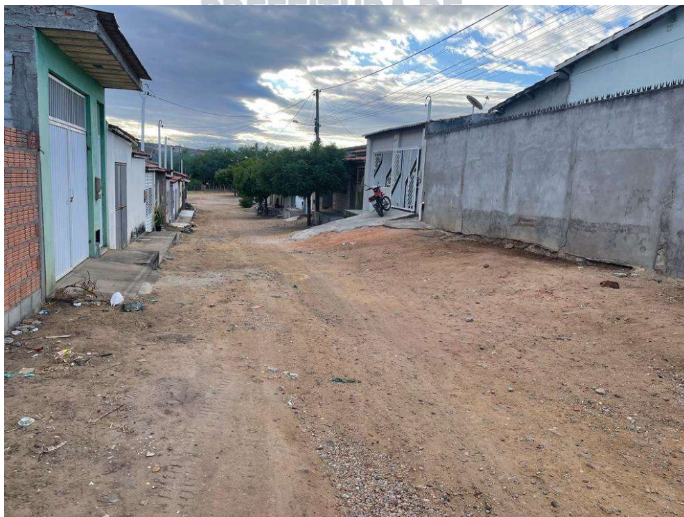
Figura 04– Descrição da área destinada à pavimentação em paralelepípedo Rua Juez Ferreira localizada na sede município de São José do Jacuípe-BA.