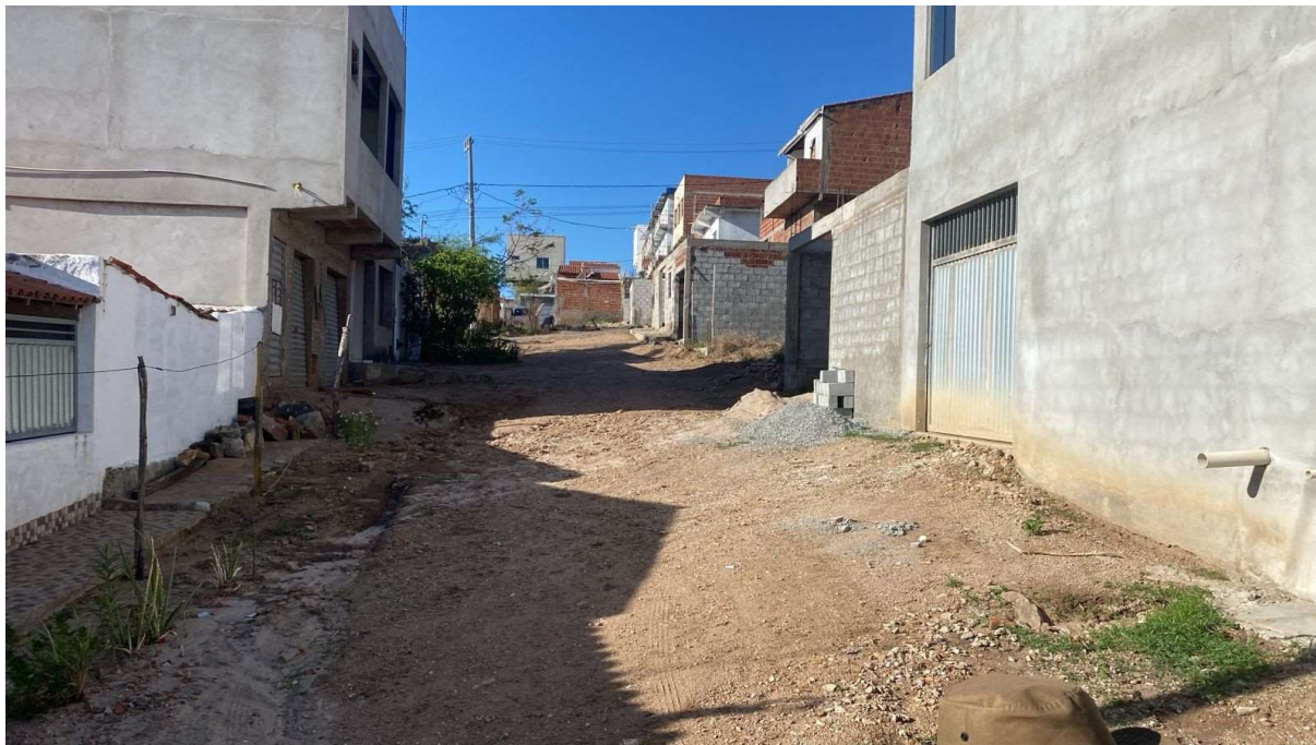
Figura 11 - Descrição da área destinada à pavimentação em paralelepípedo Rua Muricy localizada na sede município de São José do Jacuípe-BA.