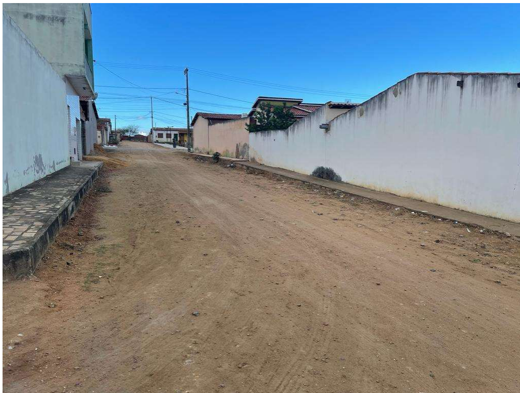
Figura 01 – Descrição da área destinada à pavimentação em paralelepípedo da rua Manuel Barreto localizada na sede município de São José do Jacuípe-BA.