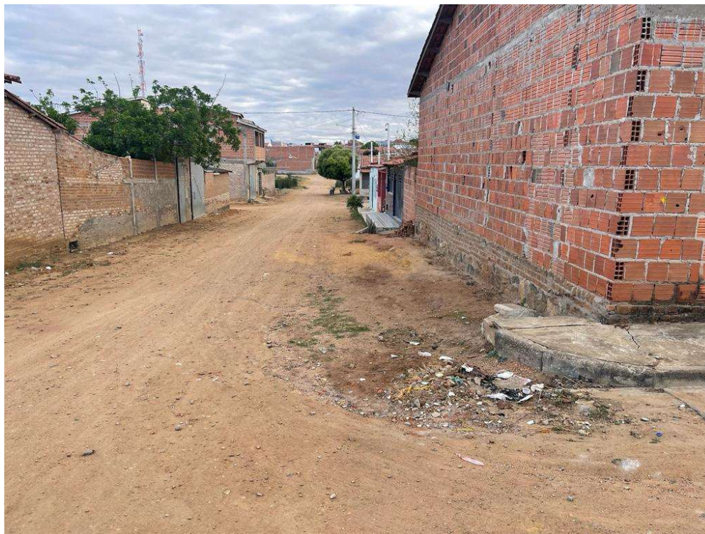
Figura 03 – Descrição da área destinada à pavimentação em paralelepípedo da rua Manuel Barreto localizada na sede município de São José do Jacuípe-BA.